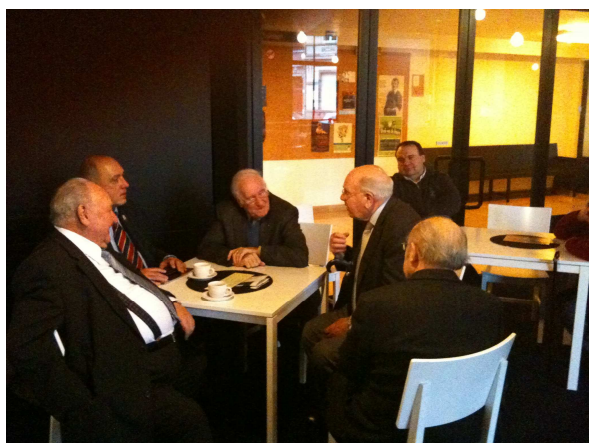
Enkele getuigen in gesprek in de cafetaria van het Cultureel Centrum en de filmposter van The Swing Kids